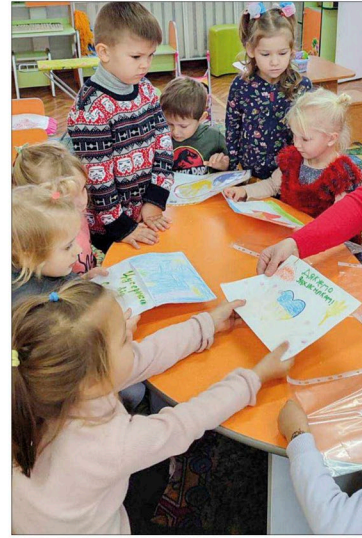
Дякуємо нашим захисникам!

Ремонт системи опалення в коридорі та санвузлів провели для садочка «Сонечко». Розпочато ремонт покрівлі. Також коштом обласного бюджету тут облаштовано сховище. У ЗДО «Веселка» проведено косметичний ремонт