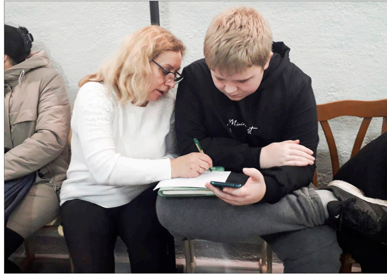
Тривога, а ти в укритті готуєшся до олімпіади з математики

Другий навчальний рік поспіль розпочався для українських школярів та освітян під звуки повітряних тривог. Щодня всі учасники навчального процесу мають долати виклики війни: вимушені перерви у навчанні, перехід на дистанційну або змішану форму навчання, повітряні тривоги та відключення електроенергії. Попри це маємо гарні результати і здобутки наших освітян та їх вихованців.